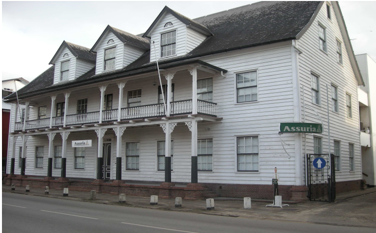
Lokatie kantoor Sticvhting Planbureau Suriname 1955 -1968

'Op 8 augustus 1955 verhuisde het kantoor van de Stichting Planbureau Suriname in verband met ruimtegebrek van de Waterkant 22 naar een daarvoor gehuurd en op kosten van de Stichting tot kantoor ingericht particulier pand aan de Gravenstraat 5