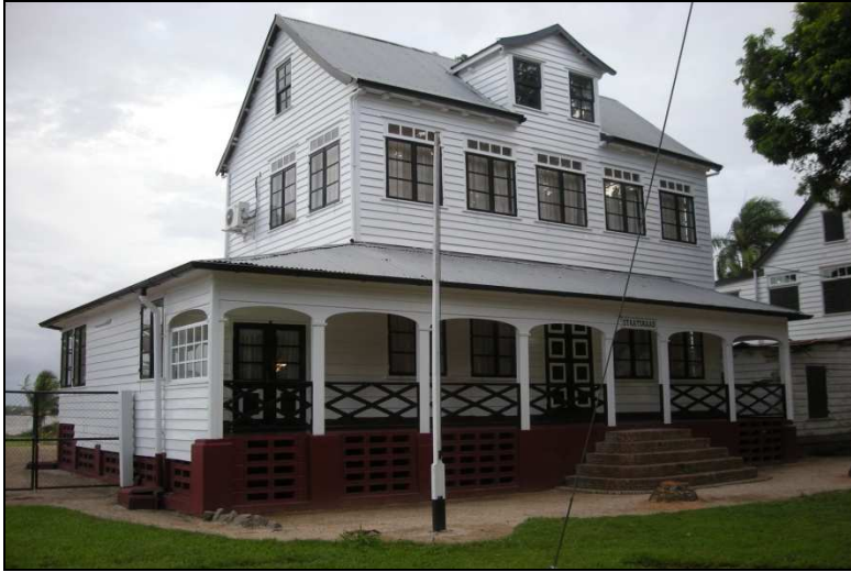
Pand in het Fort Zeelandia waar het Planbureau tot 1954 kantoor hield.

Jaarverslag Stichting Planbureau Suriname 1954: