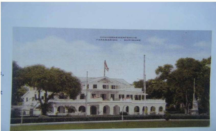
De gouverneur was van 1947-1950 voorzitter van het Coördinatie College (Planbureau)